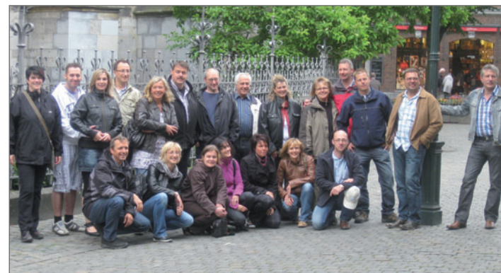
Eine gelungene Wochenendtour unternahm der Vorstand des Schützenvereins St. Sebastian Antfeld. Ziel war die Stadt Aachen, in der die Teilnehmer dem Printenbäcker über die Schulter schauen konnten, den Dom besichtigten und einen Einkaufsbummel unternahmen. Historische Kneipen ließen auch die Geselligkeit nicht zu kurz kommen.